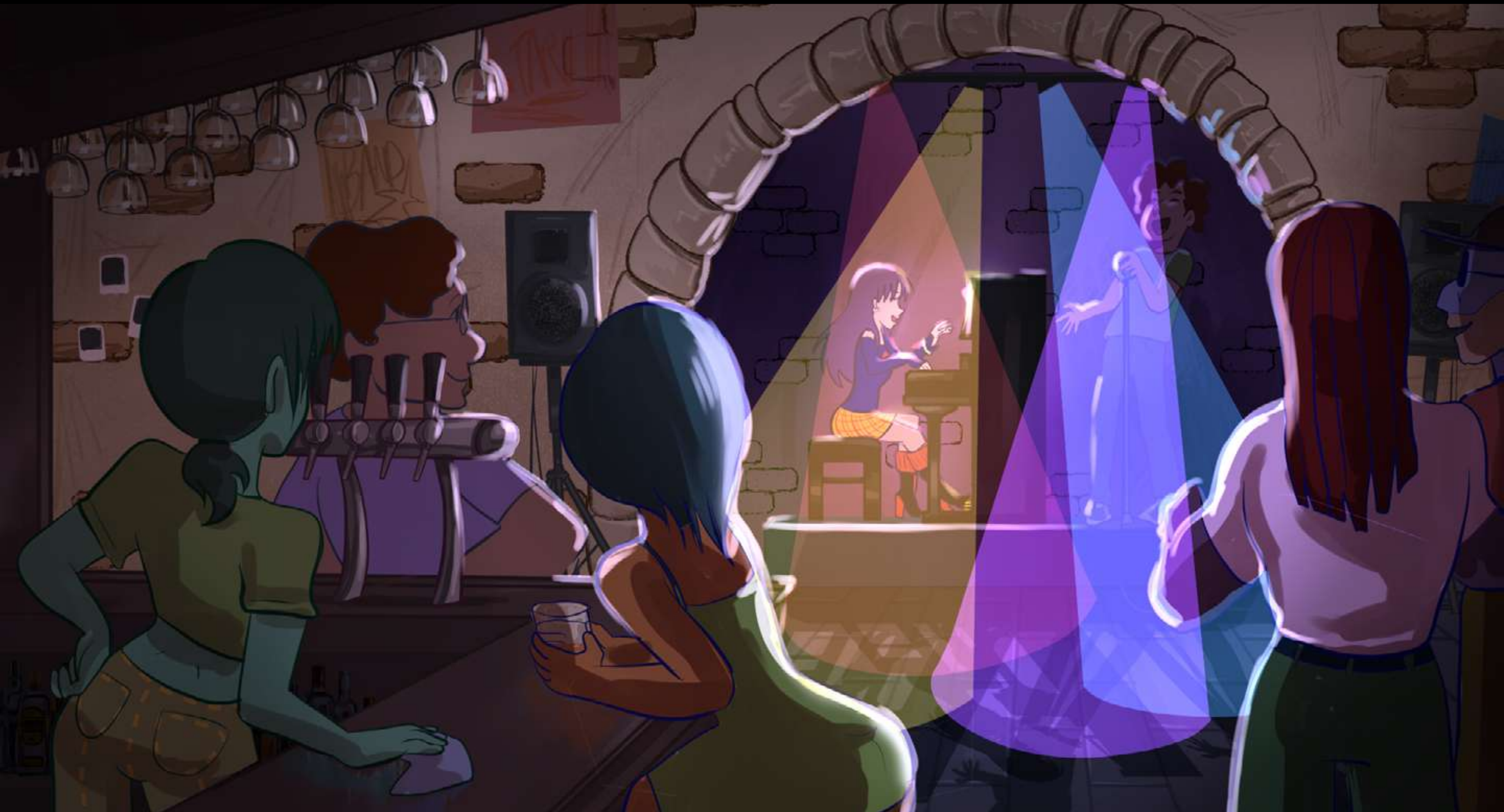
Planche concept - Épisode pilote : L'étincelle